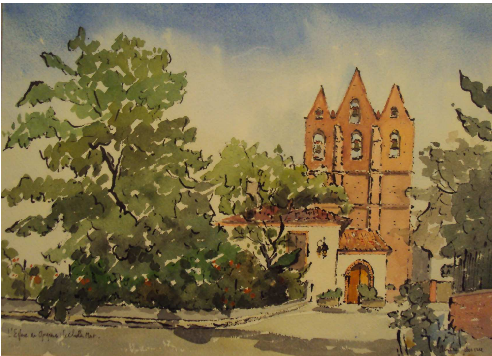
L'église actuelle (Aquarelle d'André SAUVEE)